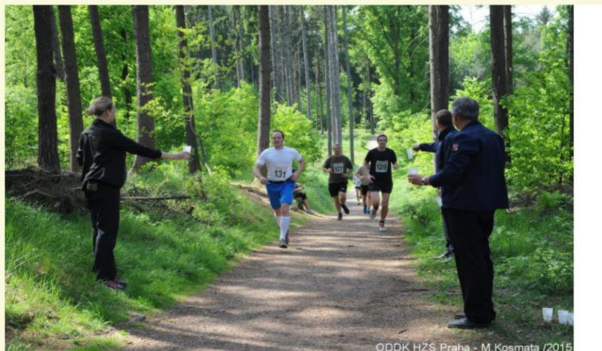
ODDK HZS Praha - M. Kosmata /2015

Prezentace a příjezdy: od 9,00 do 10,30 hodin před hotelem Globus, Praha 4, Gregorova 2115/10 (N50.0341061, E 14.4757172).